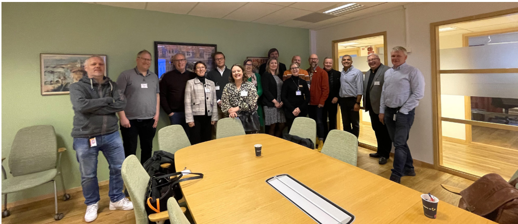
Deltagare Politikerträff Sandvik, Unionen Uppland.