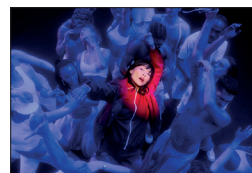
Kampanjbild för Lonely Together Stadsteatern