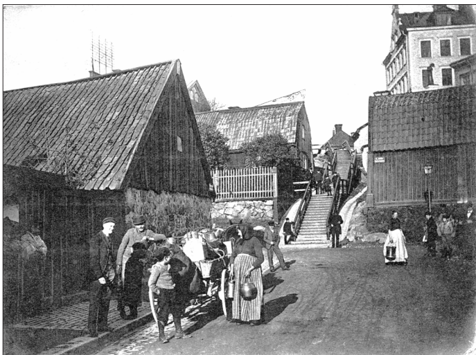
Tjärhovs tvärgård, årtal 1895-1899

Vi besöker platser ur Per Anders Fogelströms roman och följer de platser och personer som Henning möter - det första hemmet, det första arbetet och den första kärleken. Vi får höra om framtida drömmar och om en flicka som heter Lotten. Vandringen går på platser med backar och trappor. (Ö Södermalm, Skanstull via Vita Bergen till Fjällgatan) ca 2,5 km.