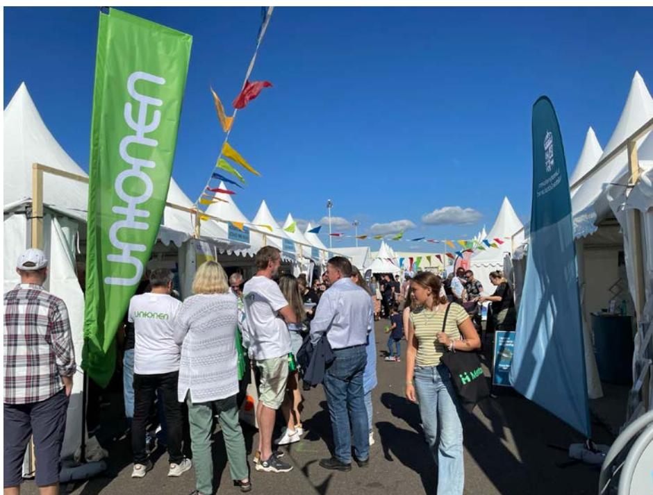
Unionen deltog med tält under Frihamnsdagarna 2024 under parollen "Be the change – bli förtroendevald".