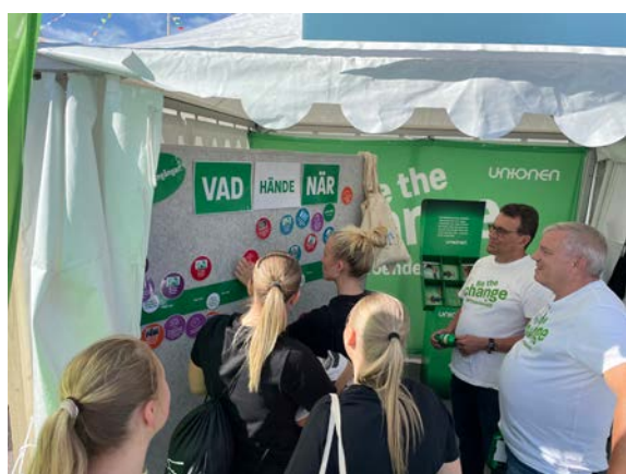
I Unionens tält kunde besökare testa sina fackliga kunskaper både på en tidslinje och i en digital quiz.