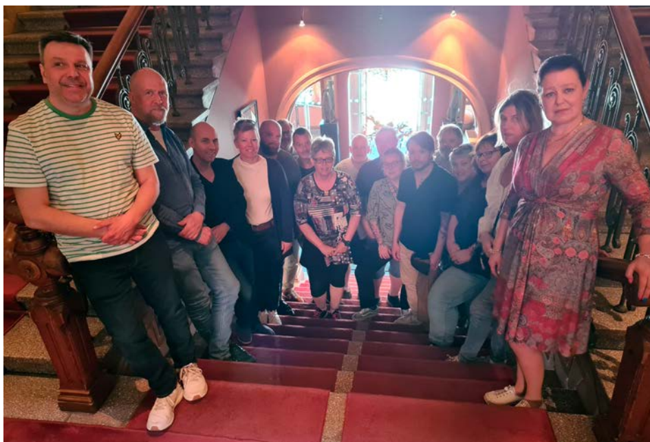
Unionen Göteborgs regionstyrelse.